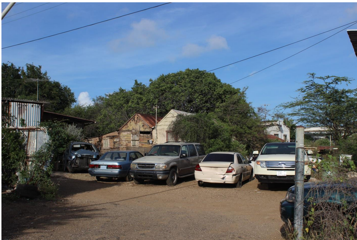
Descente 'Noorwegen' 21/11/2017