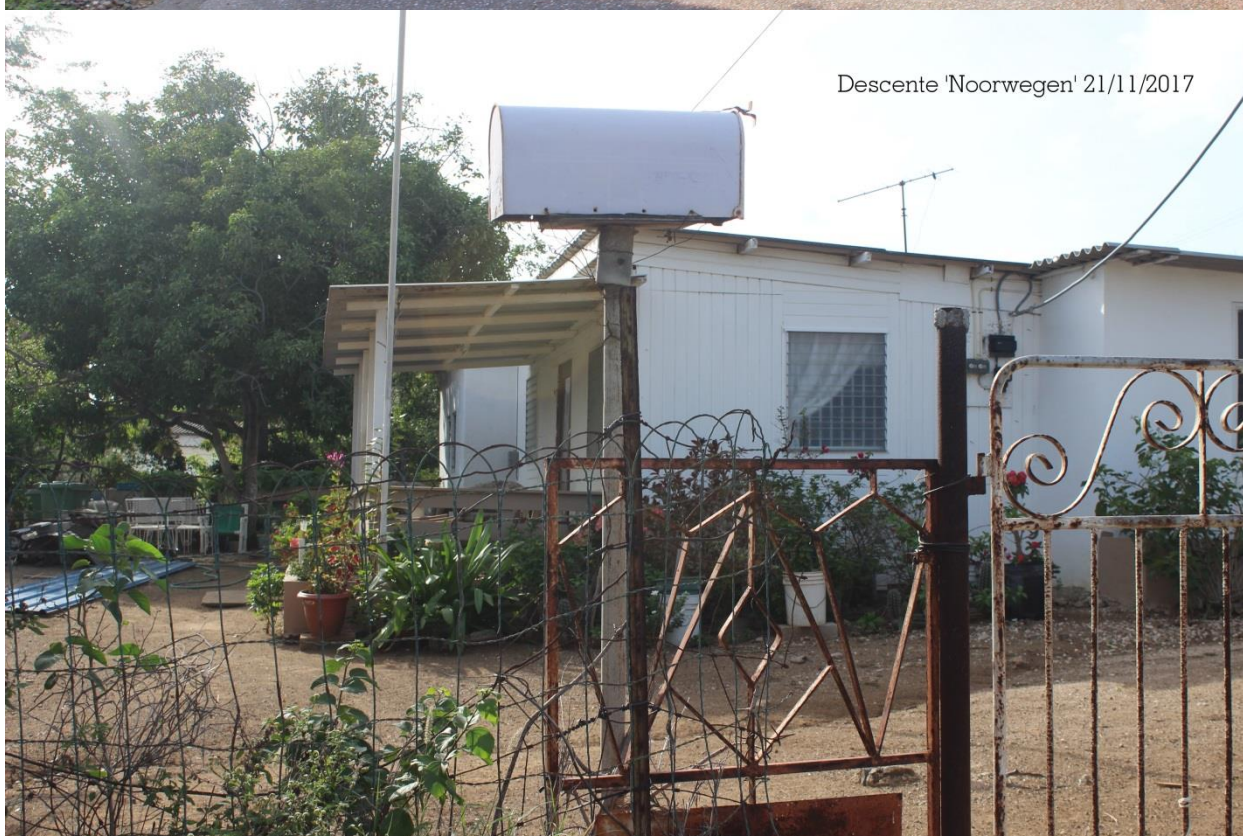
Descente 'Noorwegen' 21/11/2017