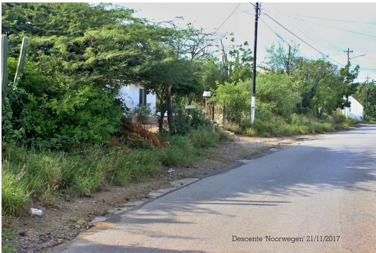
Descente 'Noorwegen' 21/11/2017