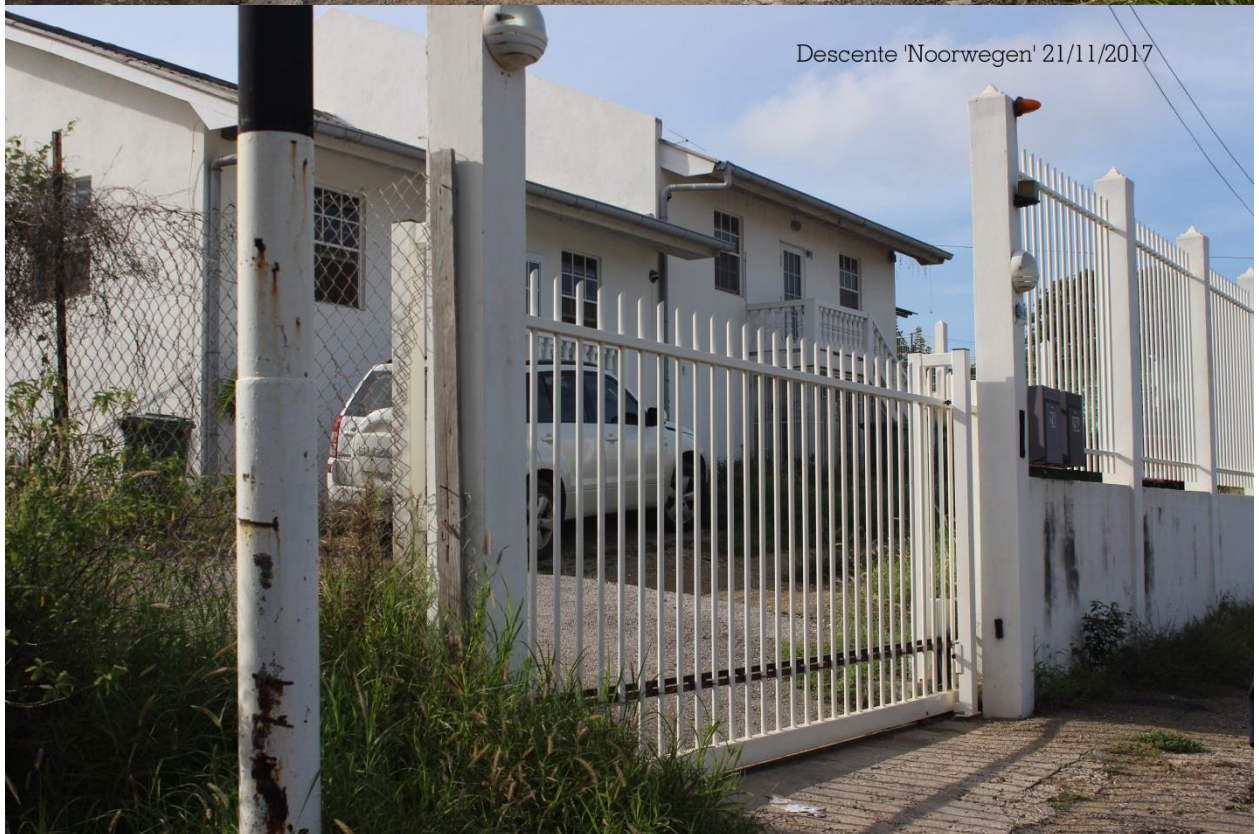
Descente 'Noorwegen' 21/11/2017