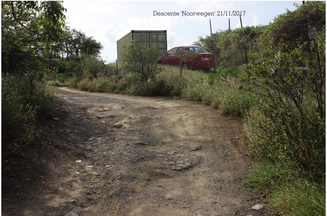
Descente 'Noorwegen' 21/11/2017